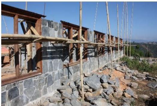
Erdgeschoß der Bimeshowr School

Der Baufortschritt bei der Bhimeshowr Lower Secondary School in Phulbari ist sehr erfreulich; das Erdgeschoß ist fast fertiggestellt. Die Einweihung kann aller Voraussicht nach im April 2012 stattfinden. Der Rotary Club Murnau-Oberammergau hat sich zusammen mit Rotary International dazu verpflichtet, bis zum Tag der Einweihung neue Schulmöbel und Lehr-/Lernmaterial, sowie Schuluniformen für alle Schüler zur Verfügung zu stellen.