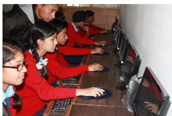
Schüler der Jaycees School bei der Ausbildung