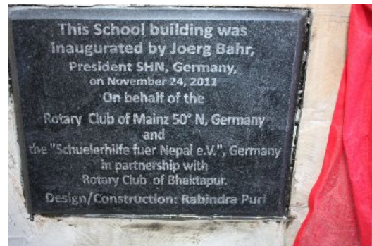
Tafel am Haupteingang des Gebäudes

Der Baufortschritt bei der Bhimeshowr Lower Secondary School in Phulbari ist sehr erfreulich; das Erdgeschoß ist fast fertiggestellt. Die Einweihung kann aller Voraussicht nach im April 2012 stattfinden. Der Rotary Club Murnau-Oberammergau hat sich zusammen mit Rotary International dazu verpflichtet, bis zum Tag der Einweihung neue Schulmöbel und Lehr-/Lernmaterial, sowie Schuluniformen für alle Schüler zur Verfügung zu stellen.