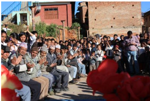
Teilnehmer an der Grundsteinlegung

stattfinden. Auch hier werden Rotarier dafür sorgen, daß das Gebäude mit neuen Schulmöbeln etc. ausgestattet wird.