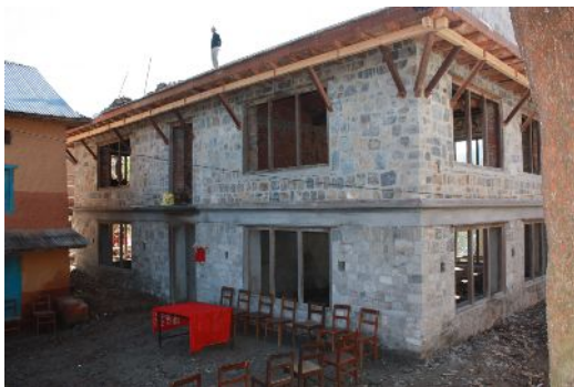
Neues Schulgebäude Sarashwoti School

Monate später als geplant – das neue Schulgebäude eingeweiht werden. Zwar waren die Fensterscheiben noch nicht eingesetzt und auch die Fußböden im oberen Stockwerk noch nicht ganz fertig, aber das Gebäude kann nun endlich benutzt werden. Die Einweihung war ein freudiges Ereignis für die Schüler, Lehrer und Eltern. Vertreter der einzelnen Parteien, der Schulbehörde und des Rotary Clubs Bhaktapur waren anwesend.